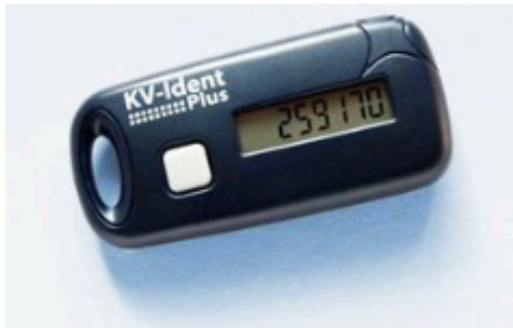
Token für KV-Ident Plus

So bringen Sie Ihre VPN-Software für das Mitgliederportal auf den aktuellen Stand