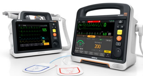
MINDRAY-DS30 und DS60